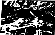
اقلمی سید و شریف میں واقع ایچا صاحب کی رہائش کا دورہ دفتر کا ایک نمونہ پشاور کے محمد علی جناح بینکرگروہ سے (ایسٹاسٹیمٹ نمبر ۱۹۵۴)۔