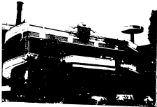
بنیاد تحقیقاتی کیمیا (۲۰۰۵)، آردشیر، جمهوری آذربایجان