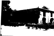
ادارہ تعلیمی کونگلی خدمات کا آئیڈیل سٹر۔ اب سعادت میوزیم کی حدود میں (2005ء)۔ پشاور پریذیڈنسی میوزیم، ایف بی سی