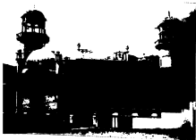
۲۰۰۶ء کو نیشنل انسٹیٹیوٹ آف ٹیکنالوجی (NIT)، سرائین (پہلی آئی ایم)