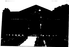
سعادت میوزیم کے سابقہ سٹر (2005ء)۔ پشاور پریذیڈنسی میوزیم، ایف بی سی