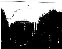
۲۰۰۶ء کو نیشنل انسٹیٹیوٹ آف ٹیکنالوجی (NIT)، وارنگل (پہلی آئی ایم)