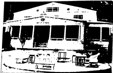
ملکی بینکرز اور پاکستانی بینکاری کی سرکاری قیادت کا ایک نمونہ۔ پشاور کے محمد علی جناح بینکرگروہ سے (ایسٹاسٹیمٹ نمبر ۱۹۵۴)۔